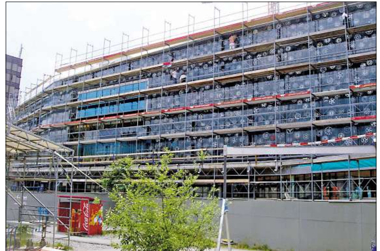
Für den Neubau im Verkehrshaus Luzern erstellte die Montageabteilung der Firma Wiederkehr das Fassadengerüst sowie provisorische Überdachungen.

Seit 1970 entwickelt und produziert die Wiederkehr AG in Zusammenarbeit mit Partnerbetrieben in der Region eigene Gerüste und ist