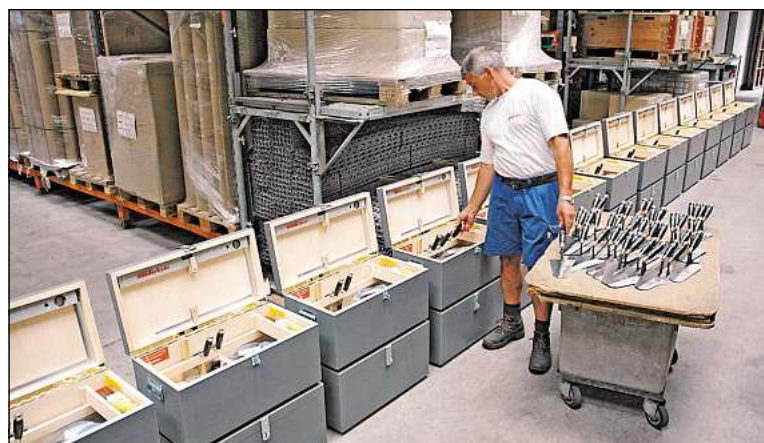
Ausrüstung von Werkzeugkisten für Verkehrswegebauer. Die Werkzeugkisten werden in einer Behindertenwerkstatt in der Region Luzern hergestellt.

heute der einzige Gerüstanbieter, welcher noch in der Schweiz produziert.